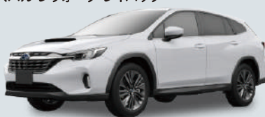
スバル レヴォーグ レイバック