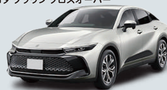
トヨタ クラウン クロスオーバー