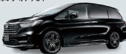
ホンダ オデッセイ