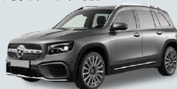
メルセデス・ベンツ GLB