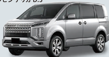
三菱 デリカ D:5