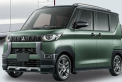
ミツビシ デリカミニ