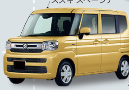
スズキ スペーシア