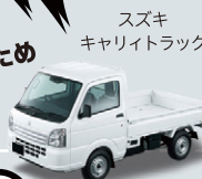
スズキ キャリイトラック